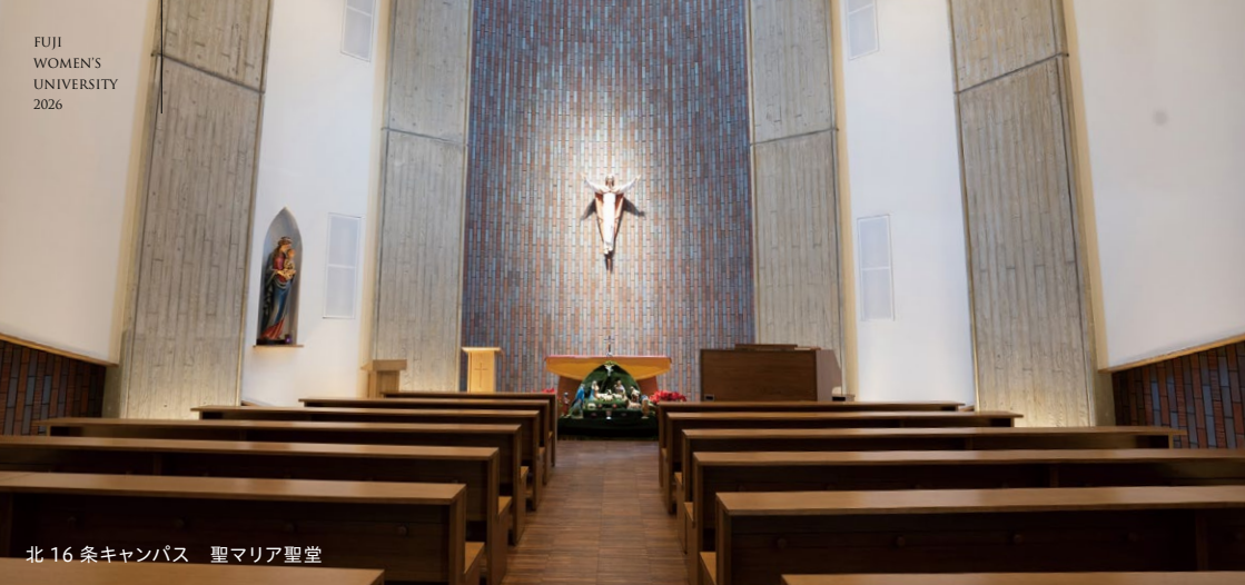
北16条キャンパス 聖マリア聖堂