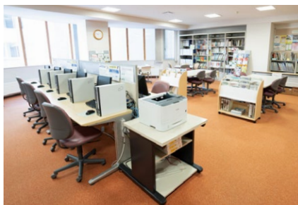
【北16条キャリア支援室】